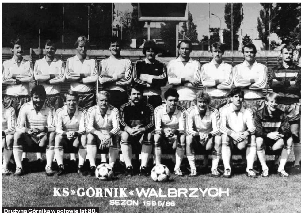
KS »GÓRNIK« WAŁBRZYCH SEZON 1985/86

„Graj Górniku jak za dawnych lat, gdyś do ekstrakla- sy pukał bram...”