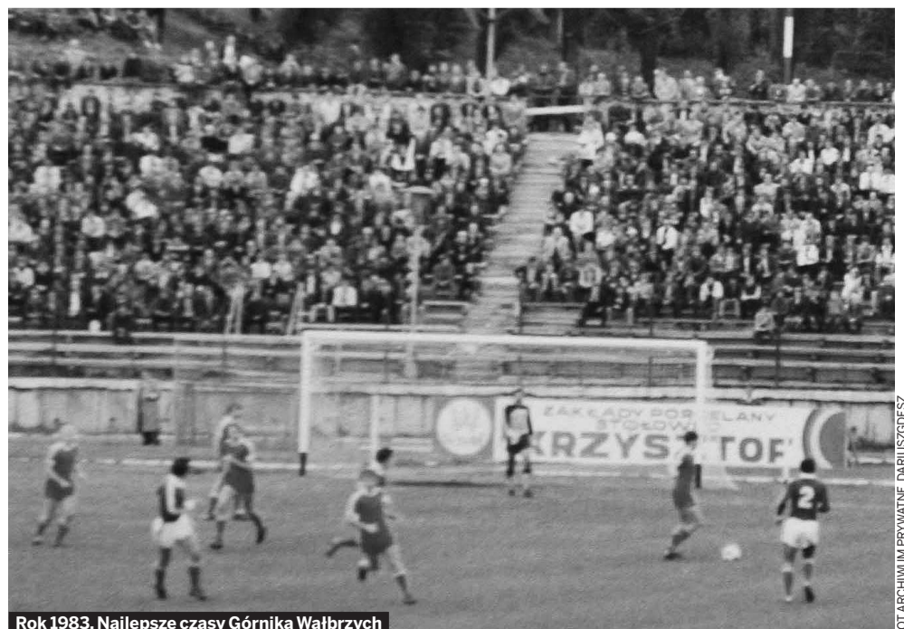
Rok 1983. Najlepsze czasy Górnika Wałbrzych